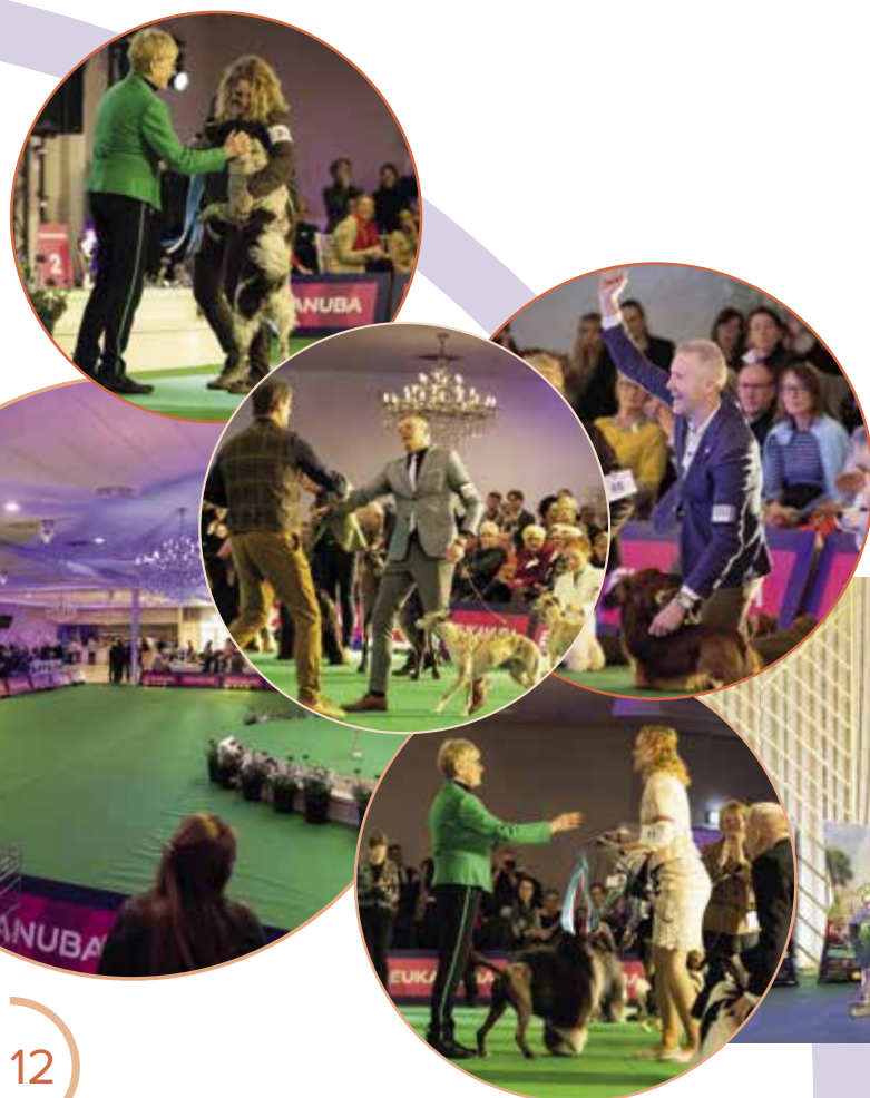
Winnaar Hond van het jaar show 2022