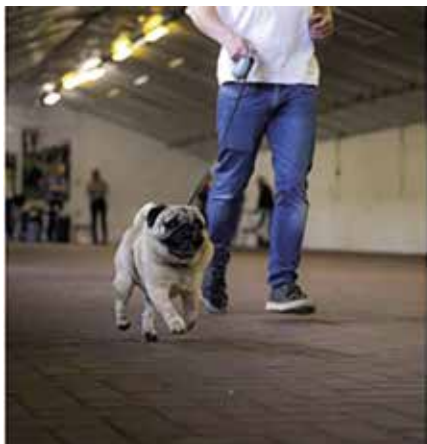
Mopshondje tijdens looptest

Dat deze gevalideerde screening belangrijk is, blijkt uit het feit dat deze in 2023 ook in Canada en de Verenigde Staten gelanceerd is.