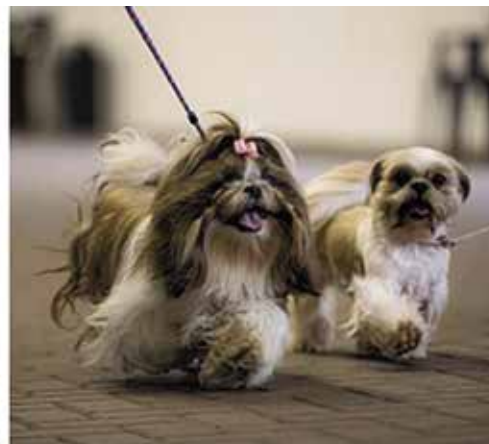
Shih Tzu tijdens looptest

Succesvolle BOAS-nulmeting | Op zondag 26 maart vond in het Dogcenter in Kerkwijk de tweede BOAS-nulmeting plaats bij honden die horen bij de brachycefale rassen. In totaal zijn er 144 honden beoordeeld, onder meer om te zien of ze functioneel kunnen ademen. In 2022 deden we de eerste nulmeting bij 65 honden, wat het totaal brengt op meer dan 200 honden.