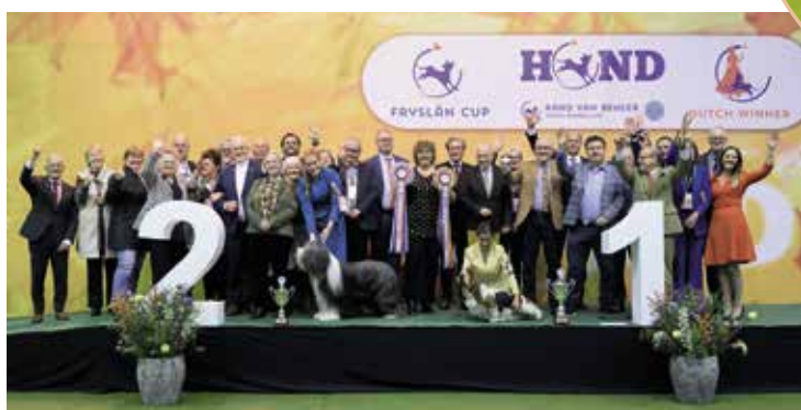
Winnaars Fryslân Cup 2023