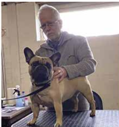
De honden worden voor en na de looptest beluisterd