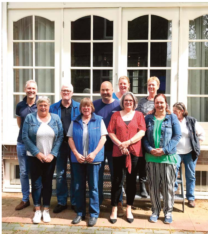
Ons chipper-team. Maak een afspraak met uw regionale chipper en vraag zo nodig een servicegesprek aan.

Er staat al een aantal Fokkercafés gepland voor de komende tijd: